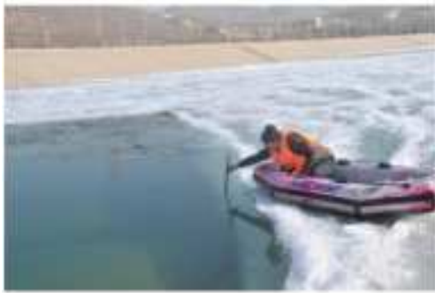
图 2 渠道冰塞 Fig. 2 Ice jam of the channel