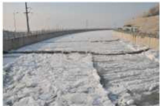
图 4 隧洞进口拦冰索断裂 Fig. 4 Ice boom broken at the intake of tunnel

沿线某隧洞上游渠段布置复杂,隧洞进口上游有 14.5 km 的明渠输水段,由上而下布置另一个隧洞(2 207 m)、渡槽(2 199 m),渡槽出口接 900 m 开挖石渠段至该隧洞,隧洞进口布置两道拦冰索。2016 年 1 月 23 日,隧洞进口出现严重冰塞,进口前两道拦冰索先后相继断裂,冰塞体整体下移,强烈撞击隧洞进口导墙,威胁隧洞节制闸安全,见图 4。事后一方面紧急放下检修闸门,保护节制闸;另一方面,在上游渡槽进口上游 1 km 断面临时增设拦冰索,有效拦截上游流冰,控制了隧洞进口前冰塞体积的发展。