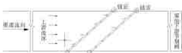
图 7 拦冰索双排布置 Fig. 7 Double row layout of ice boom

(c)结合渠道和建筑物布置特点,长距离渠段需增设拦冰索,分割明渠段长度,逐段拦冰,一般推荐间隔距离为 5~10 km,采用双排布置。