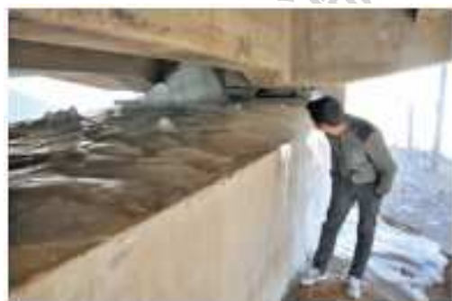
图 6 渡槽渗漏 Fig. 6 The leakage of aqueduct