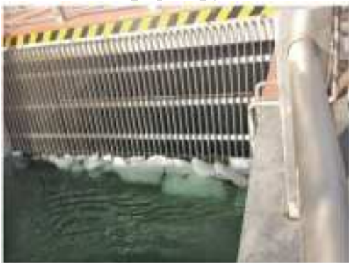
图 3 流冰堵塞拦污栅 Fig. 3 Trash rack blocked up by ice

在工程下游渠段布置一个提水泵站,该渠段工程布置复杂,泵站前池上游直接暗渠(长 1 670 m)出口,暗渠上游为倒虹吸(长 685 m),两者之间明渠长约 3.0 km,泵站前池、暗渠进口分别设有拦污栅,同时暗渠进口前布置箱式拦冰索。2015—2016 年度该渠段出现严重冰情,见图 3。