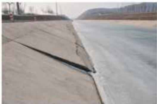
图 5 边坡冻胀 Fig. 5 Frost heave damage of channel slope

根据近几年观测,结冰对工程结构的影响主要表现在渠道边坡衬砌冻胀和渡槽冬季漏水。一般冬季气温越低,冻胀破坏越严重,见图 5。冬季受低温影响渡槽槽身接缝出现裂缝,导致渡槽漏水,见图 6。